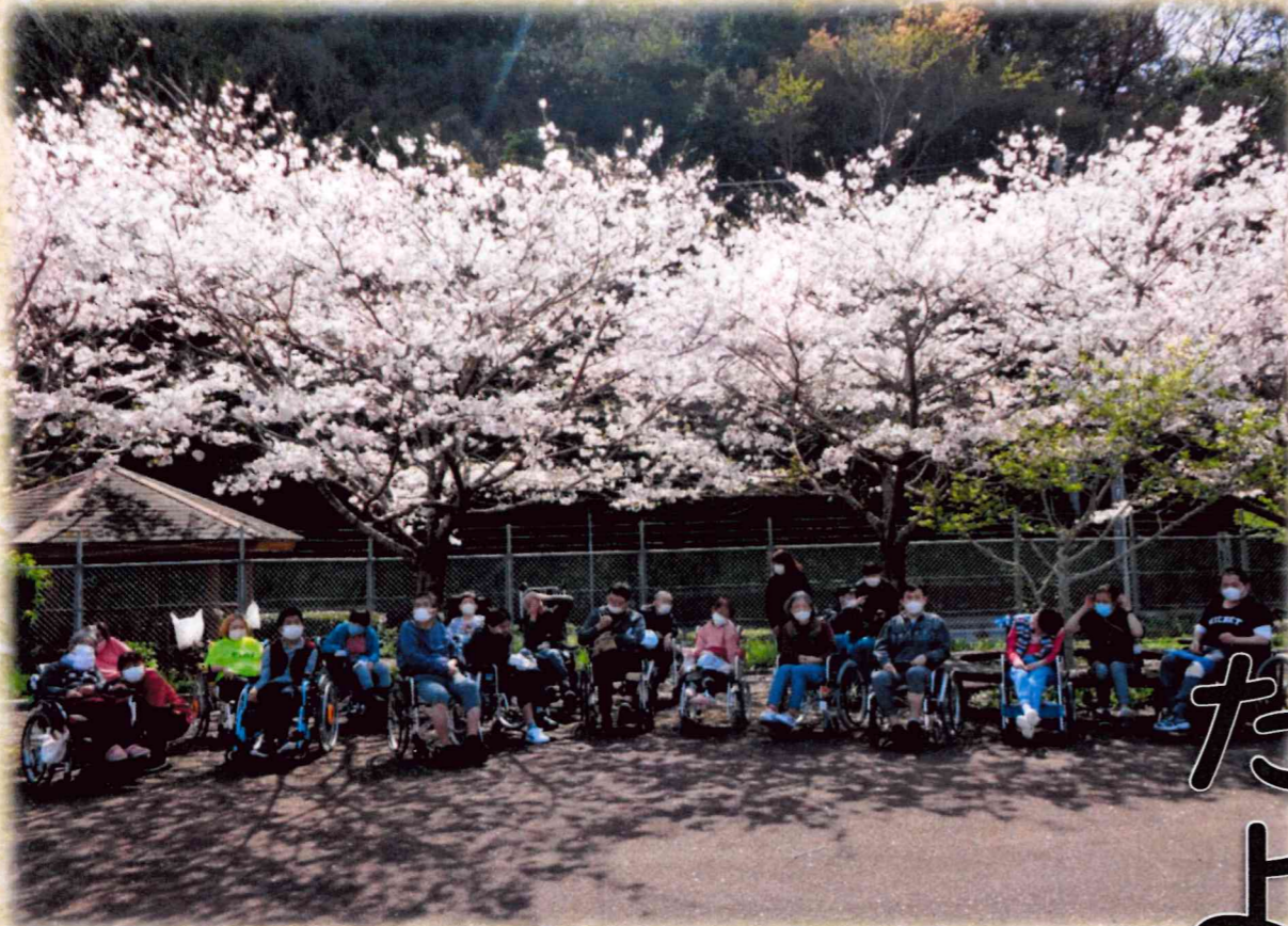
(3月28日 お花見 さくら公園)